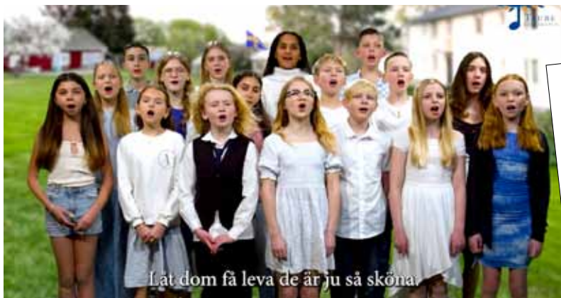
En av skolorna som deltar är Rådmanö skola.

UNDER JUNI MÅNAD ljuder dessa strofer extra många gånger över skolgårdarna runtom i hela vårt avlånga land. Anledningen är att hundratals lärare har hörsammat Taubesällskapet uppmaning att sjunga sången Änglamark på skolavslutningen 2024.