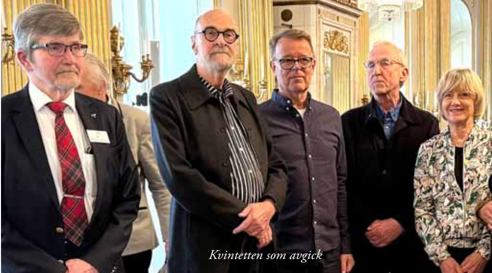
Kvintetten som avgick