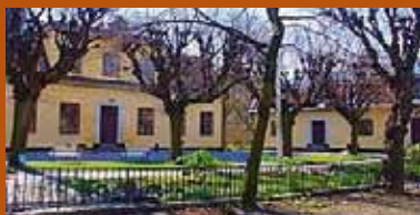
Kristinehavs Malmgård Kristinehovsgatan 2, 117 29 Stockholm

Betalning på plats - swish eller kontant