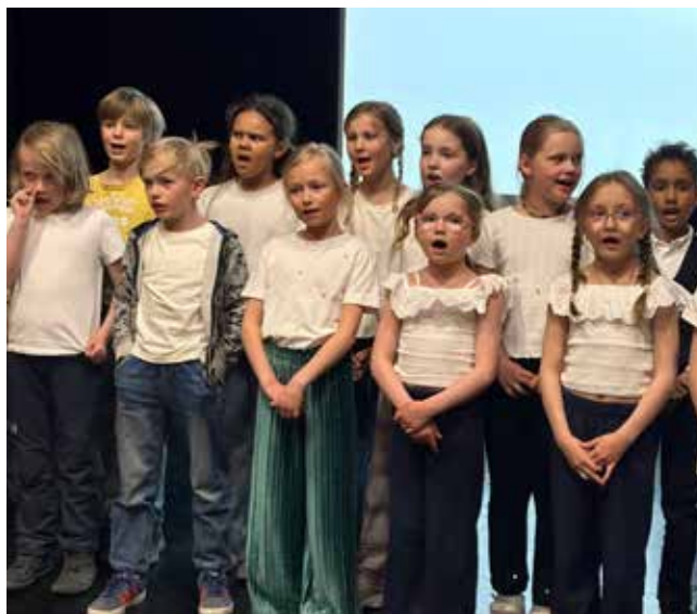
Eleverna i klass 2 i Kungsholmens friskola visade varför just de vunnit årets Änglamarksutmaning. De sjöng inte enbart ”Änglamark” utan även ”Albertina”.